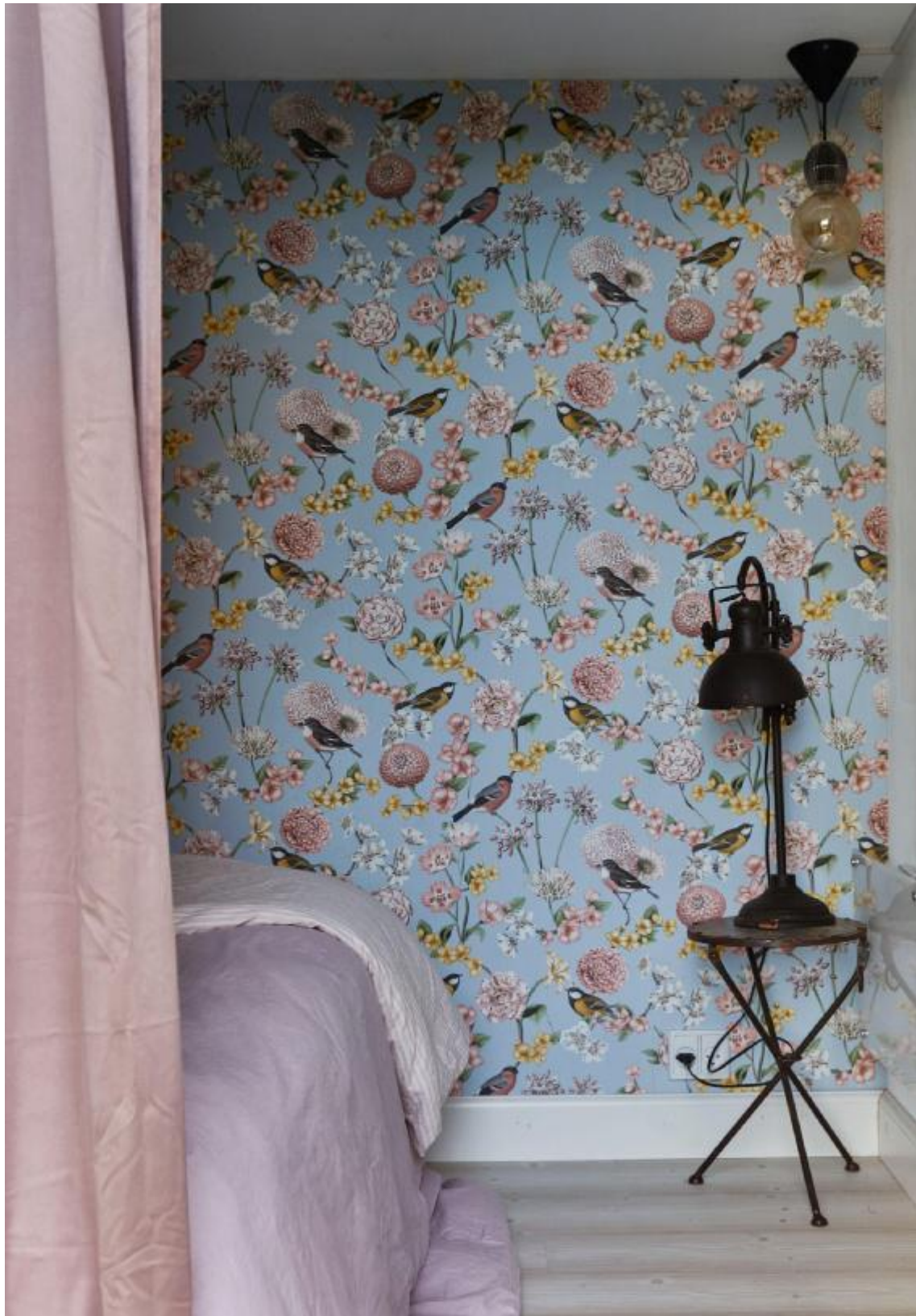
Et kig ind i et af husets soveværelser, som har en del mere kulør end de øvrige rum, dog med inspiration fra naturen med fugletapet og bløde rosa tekstiler.