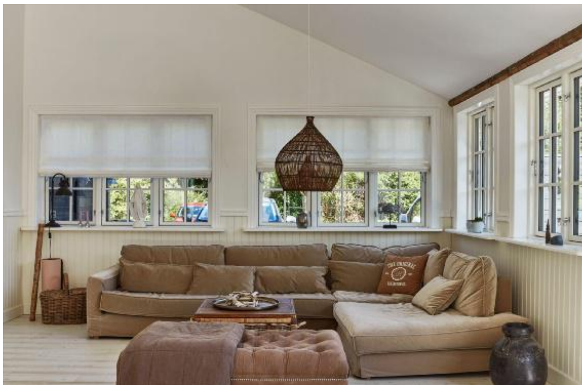
Den store hjørnesofa og puffen i velour er holdt i samme toner som det mindre tilbehør som lamper og vaser for at skabe ro og sammenhæng.